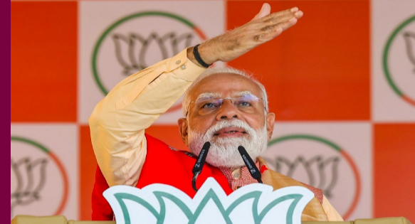
ప్రధాని నరేంద్ర మోదీ శనివారం ప్రతిపక్షాలపై తీవ్రస్థాయిలో విరుచుకుపడ్డారు. కాంగ్రెస్ తో పాటు ఇతర విపక్ష పార్టీలు 'ధురందర్', 'ది కేరళ స్టోరీ', 'ది కశ్మీర్ ఫైల్స్' వంటి సినిమాలతో

కేరళలో ఎన్నికల ప్రచారం ప్రతిపక్షాలపై తీవ్రస్థాయిలో విరుచుకుపడిన ప్రధాని మోదీ సినిమాలపై కూడా అబద్ధపు ప్రచారాలు చేస్తున్నారని ఆరోపణ 'ది కేరళ స్టోరీ', 'కశ్మీర్ ఫైల్స్', 'ధురందర్' చిత్రాల ప్రస్తావన సీఎమ్, యూసీసీలపై కూడా అబద్ధాలు వ్యాప్తి చేశారని విమర్శ