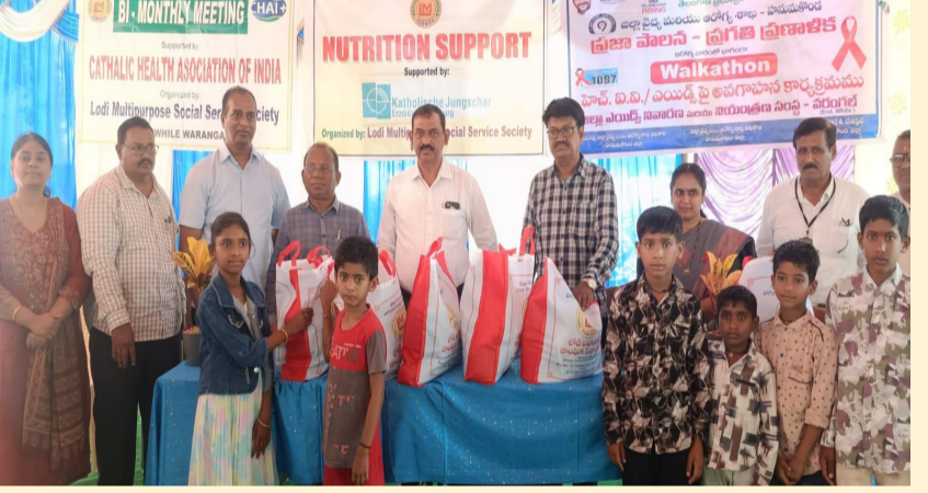
హనుమకొండ జిల్లా ఏప్రిల్ 09 నేటి వెలుగు ప్రతినిధి: