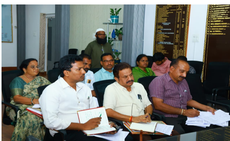
నల్గొండ ఏప్రిల్ 09 నేటి వెలుగు ప్రతినిధి

వచ్చే విద్యా సంవత్సరం ప్రారంభానికి ముందే జిల్లాలోని అన్ని ప్రభుత్వ పాఠశాలల్లో అవసరమైన మరమ్మత్తు పనులను పూర్తిచేయాలని జిల్లా కలెక్టర్ బి. చంద్రశేఖర్ ఆదేశించారు. గురువారం ఆయన తన ఛాంబర్లో పాఠశాలల్లో సివిల్ పనులు, మరమ్మత్తులు పై సమీక్షించారు. జిల్లాలోని అన్ని పాఠశాలల్లో సివిల్ పనులతో పాటు, డ్రైనేజీ, కిచెన్, మూత్రశాలలు, బాత్రూమ్ల మరమ్మత్తులు, తాగునీటి సదుపాయం, కాంపౌండ్ వాల్ నిర్మాణం, సీసీ రోడ్లు, ఆర్.ఓ. ప్లాంట్లు, ఫ్యాన్లు, ట్యూబ్ లైట్లు, కంప్యూటర్ల వంటి అన్ని అవసరాలను గుర్తించి పనులు చేపట్టాలని చెప్పారు. ఈ పనులను వివిధ కంపెనీల సహకారంతో సీఎస్ఆర్ (జూ=) నిధుల ద్వారా చేపట్టాలా చర్యలు తీసుకోవాలని, అంశాల వారీగా ప్రణాళిక సిద్ధం చేసి అమలు చేయాలని చెప్పారు. చిన్నపాటి మరమ్మత్తులను వెంటనే పూర్తి చేయాలని, పెద్ద పనులకు సంబంధించి అంచనాలు సిద్ధం చేసి సంబంధిత శాఖల ద్వారా అమలు చేయాలని ఆదేశించారు. మైనారిటీ హాస్టళ్లు, పీఆర్ విభాగానికి