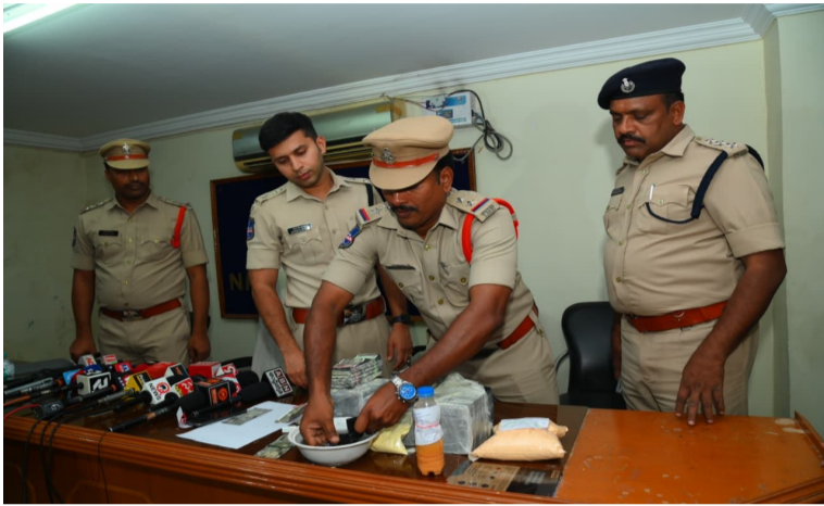
- జిల్లా ఎస్పీ శరత్ చంద్ర పవార్ పీఎస్ .. నల్గొండ జిల్లా ఏప్రిల్ 09 నేటి వెలుగు ప్రతినిధి

నల్గొండ జిల్లా తిప్పర్తి మండల పరిధిలో నకిలీ ₹100 రూపాయల నోట్ల ఆకారంలో ఉన్న కాగితాల పేరుతో అమాయక ప్రజలను మోసం చేస్తున్న ఒక నిందితుడిని పోలీసులు అరెస్ట్ చేశారు.