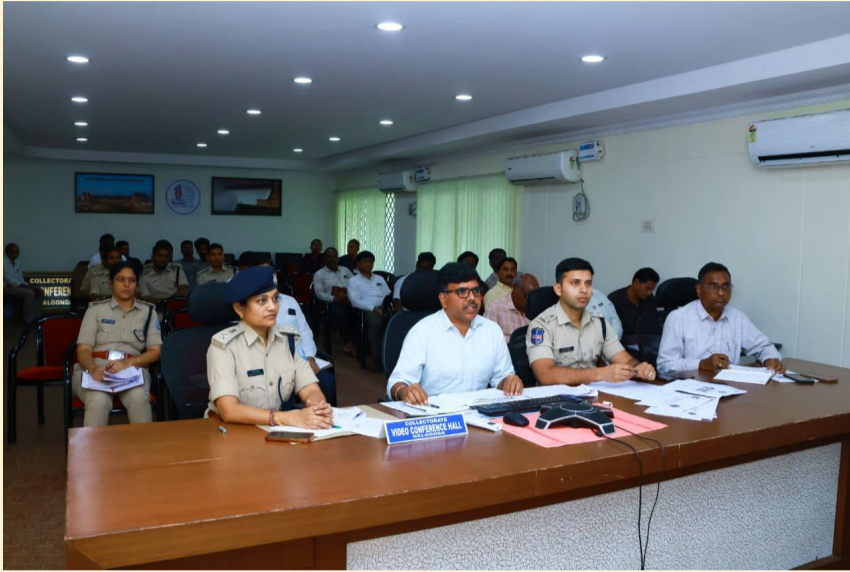
నల్గొండ ఏప్రిల్ 09 నేటి వెలుగు ప్రతినిధి